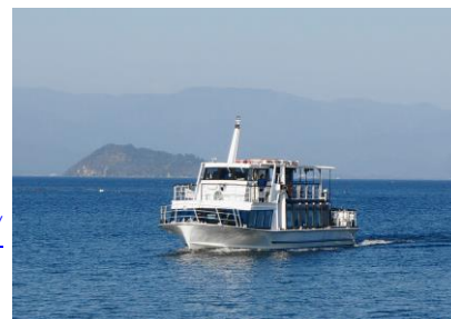
いんたーらーけん