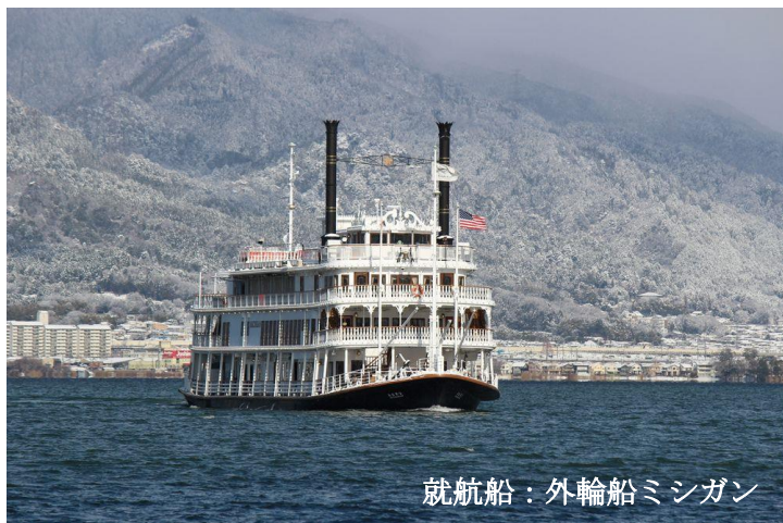
就航船：外輪船ミシガン

※2025年2月1日(土)～3月2日(日)はミシガンが定期点検の為、客船ピアンカにて運航いたします