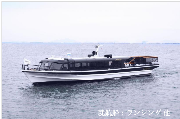
就航船：ランシング他

【南湖遊覧ボート】 期間中の平日に運航 ※年末年始 2024 年 12 月 28 日（土）～2025 年 1 月 5 日（日）を除く