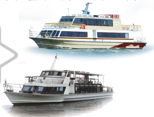
就航船：べんてん、いんたーらーけん

古くより神様が棲む島として人々の信仰を集める島、竹生島。歴史的価値のある建築物が数多く残されており、大坂城極楽橋の遺構と云われる宝厳寺の国宝「唐門」や、願い事を書いたかわらけが鳥居をくぐれば、願い事が成就すると言われていた都久夫須麻神社の「龍神拝所」など、見どころいっぱい。